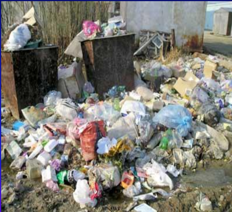
Свалка у дороги. Настоящее.