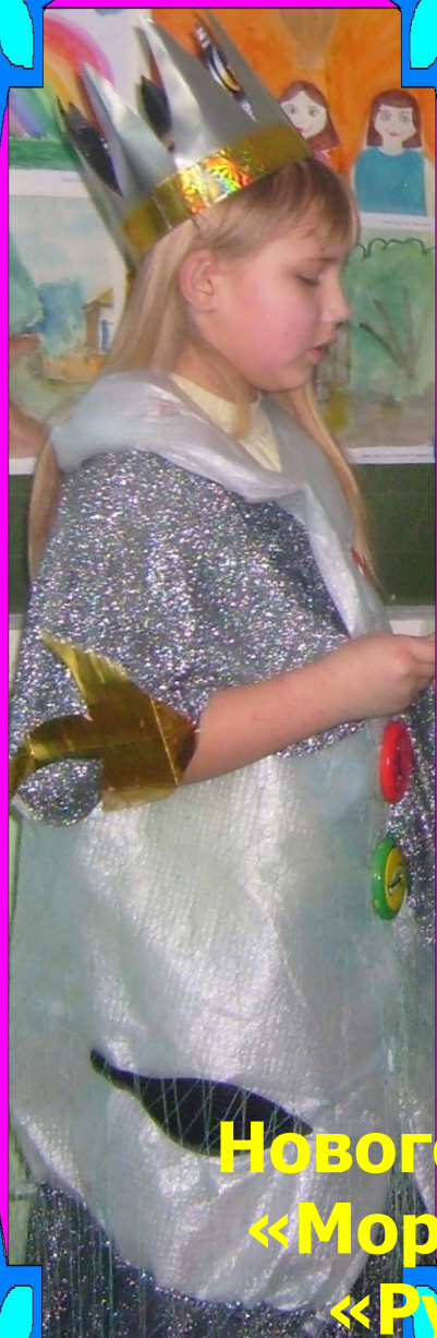
Новогодние костюмы «Морская царица» «Русалочка»