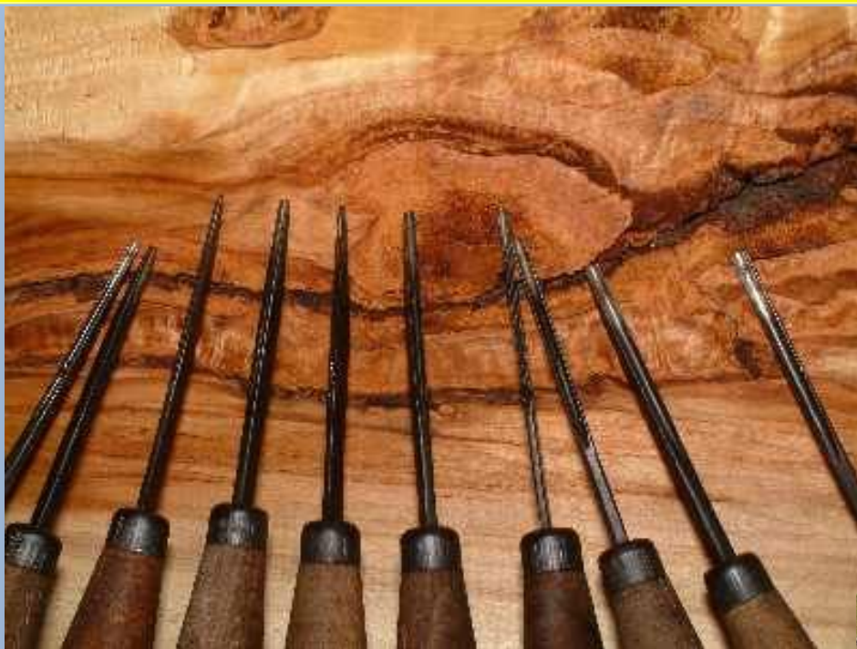
Инструмент резчика по дереву