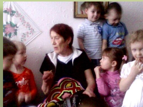
Бабушка одной из воспитанниц, рассказывает о вязании крючком

Наш музей посещают родители, сотрудники и жители села, участвуя в занятиях, праздниках и развлечениях.