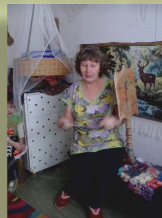
Сотрудница детского сада на занятии «Золотое веретено»