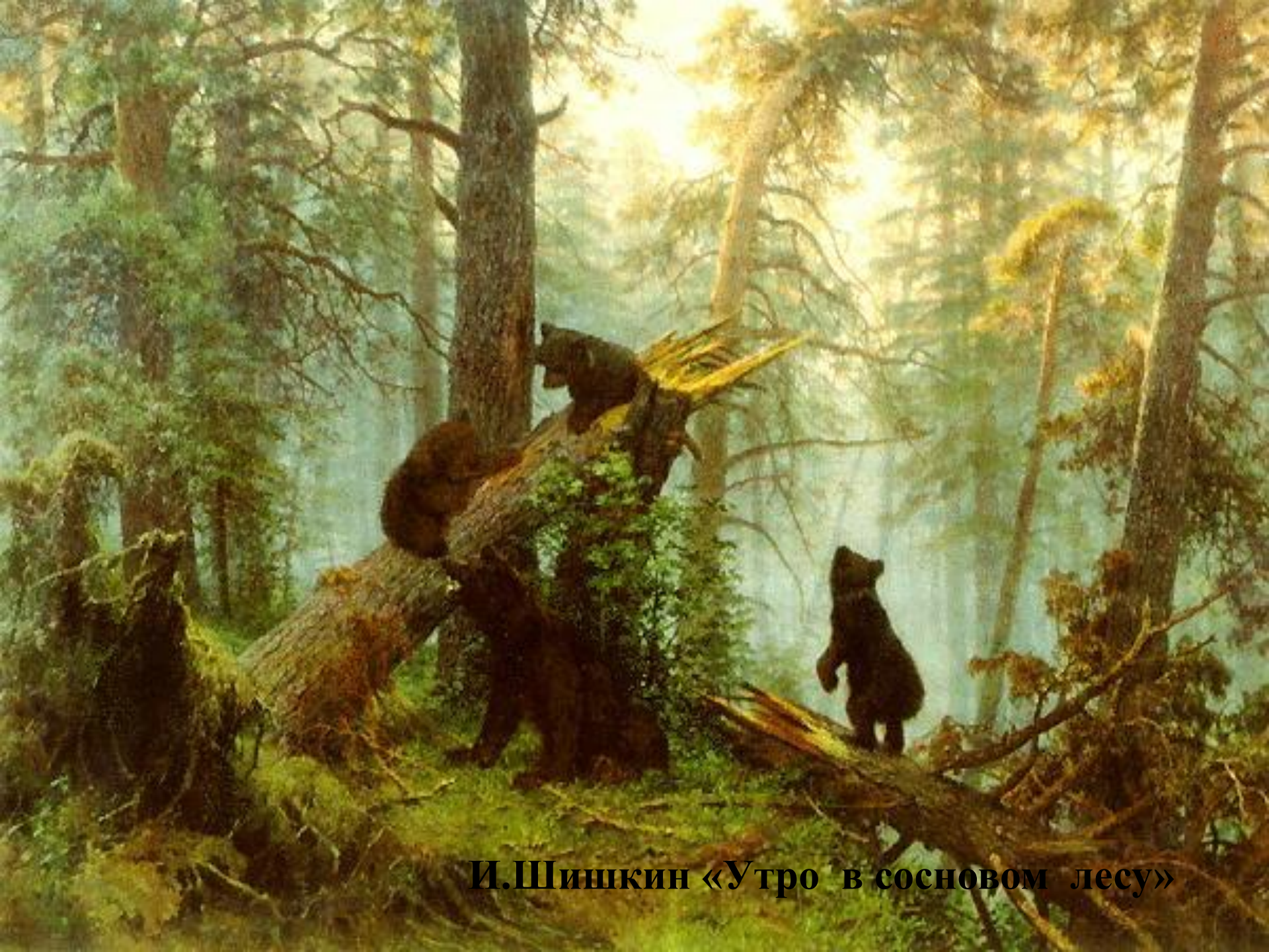
И.Шишкин «Утро в сосновом лесу»