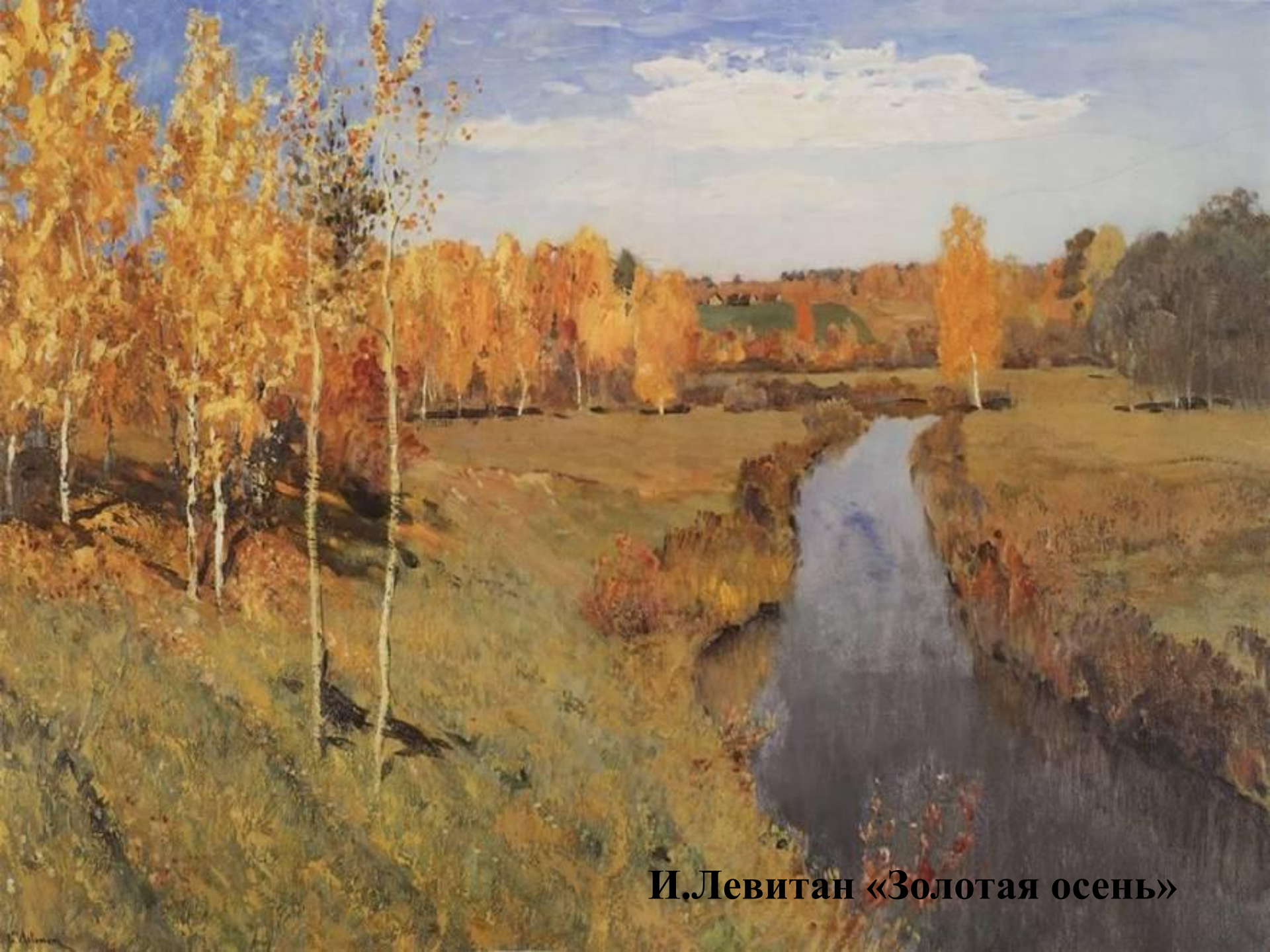
И. Левитан «Золотая осень»