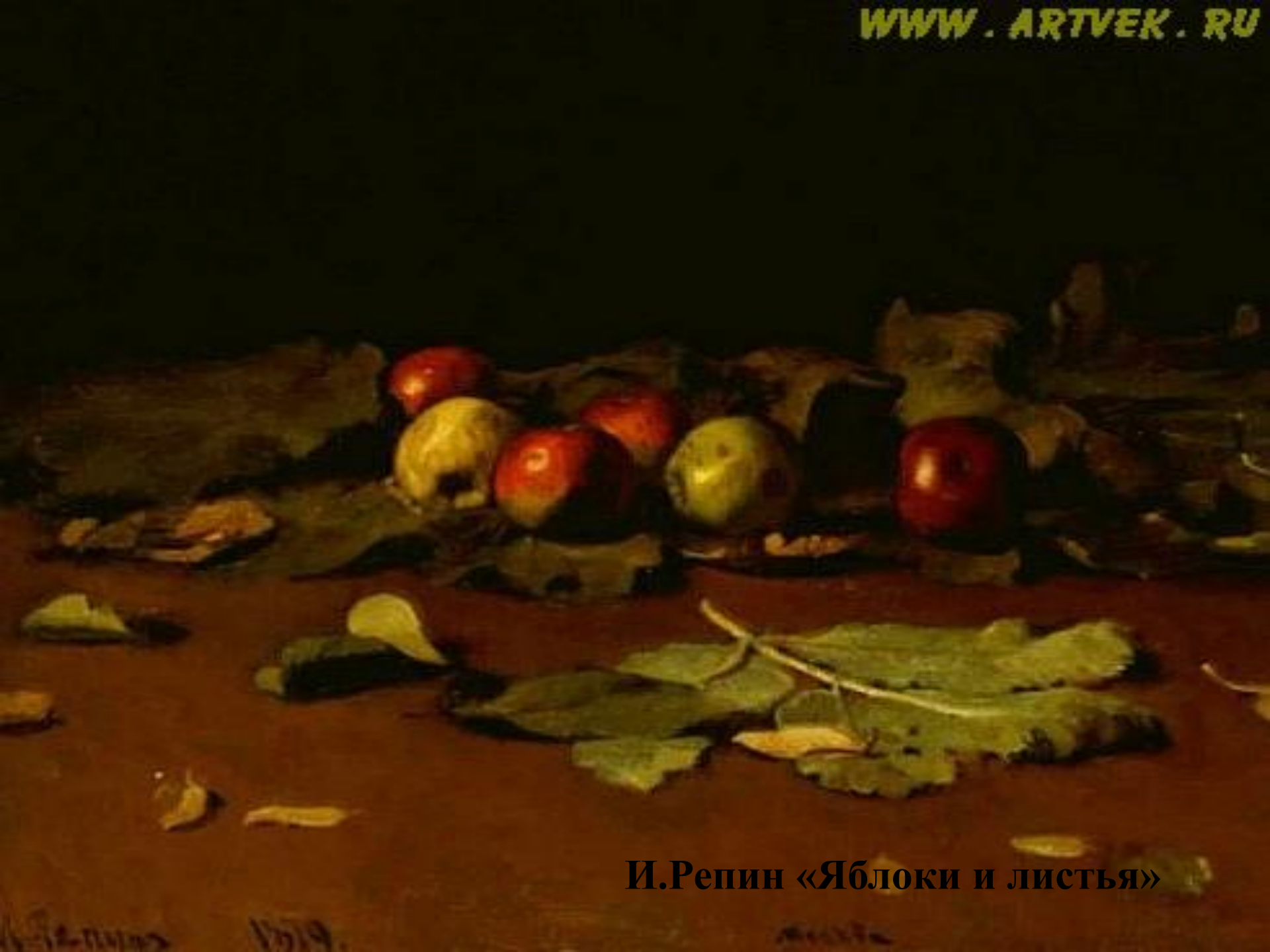
И.Репин «Яблоки и листья»