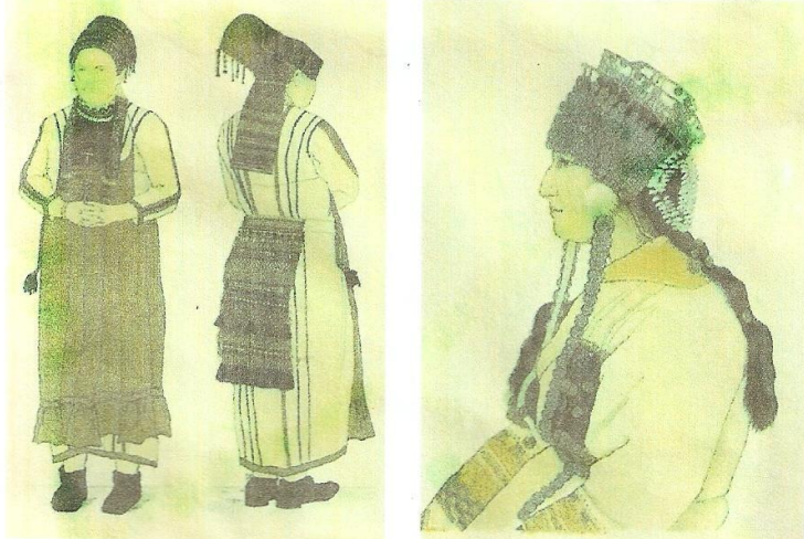
Мордовский женский национальный костюм