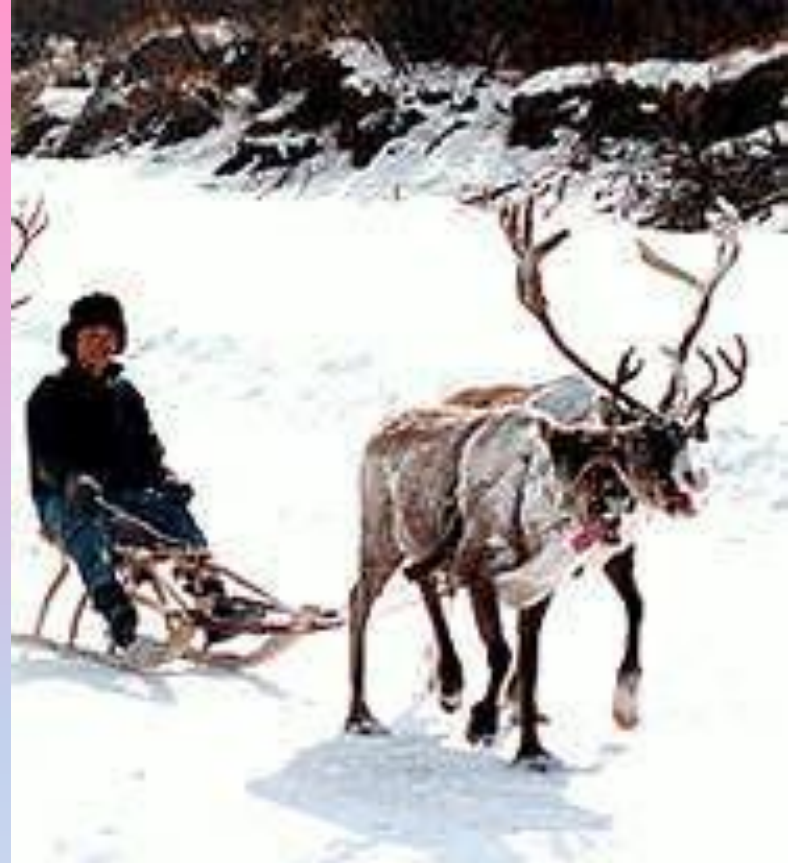
Эвенский праздник «День оленевода»