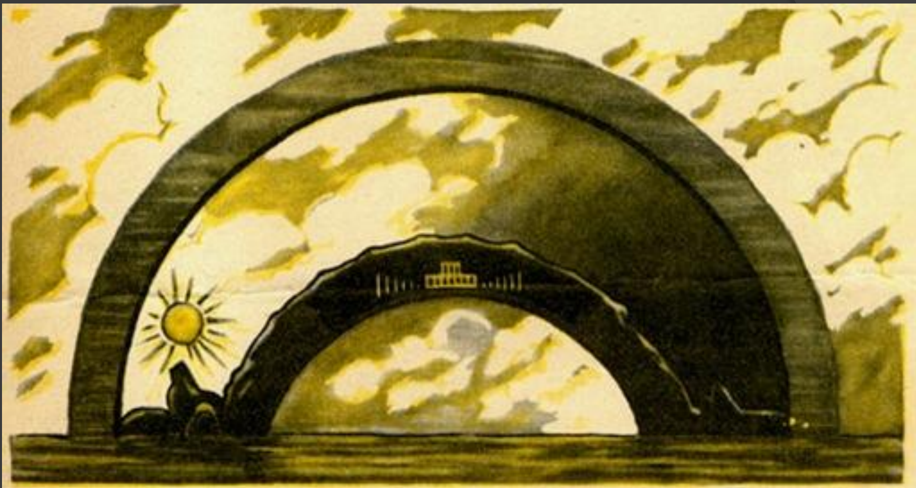
Земля по представлению древних вавилонян.