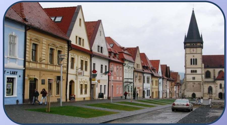
На одной из таких улиц жили герои сказки Андерсена: Кай и Герда