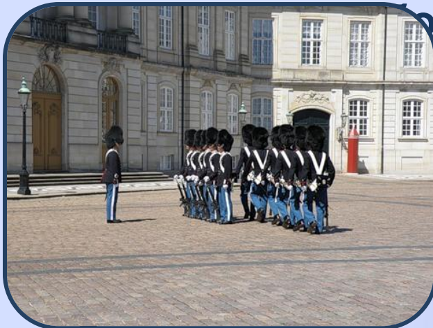
Смена караула во дворце