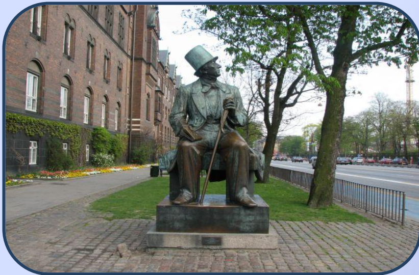
Памятник Г. Х. Андерсену