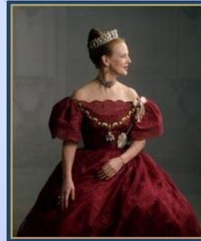
Королева Дании Маргрета II