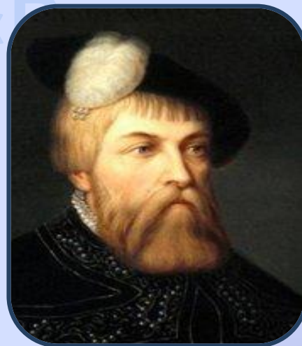
Король Швеции Густав Васа 1

Галеон – первый большой корабль в Шведском флоте