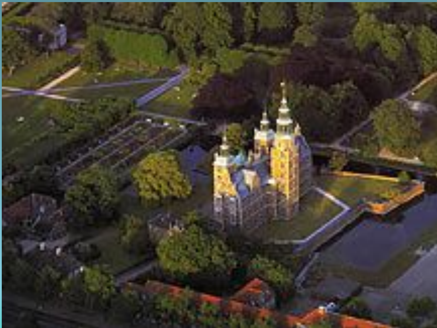
Королевский дворец Росенборг. Вид с высоты птичьего полета.