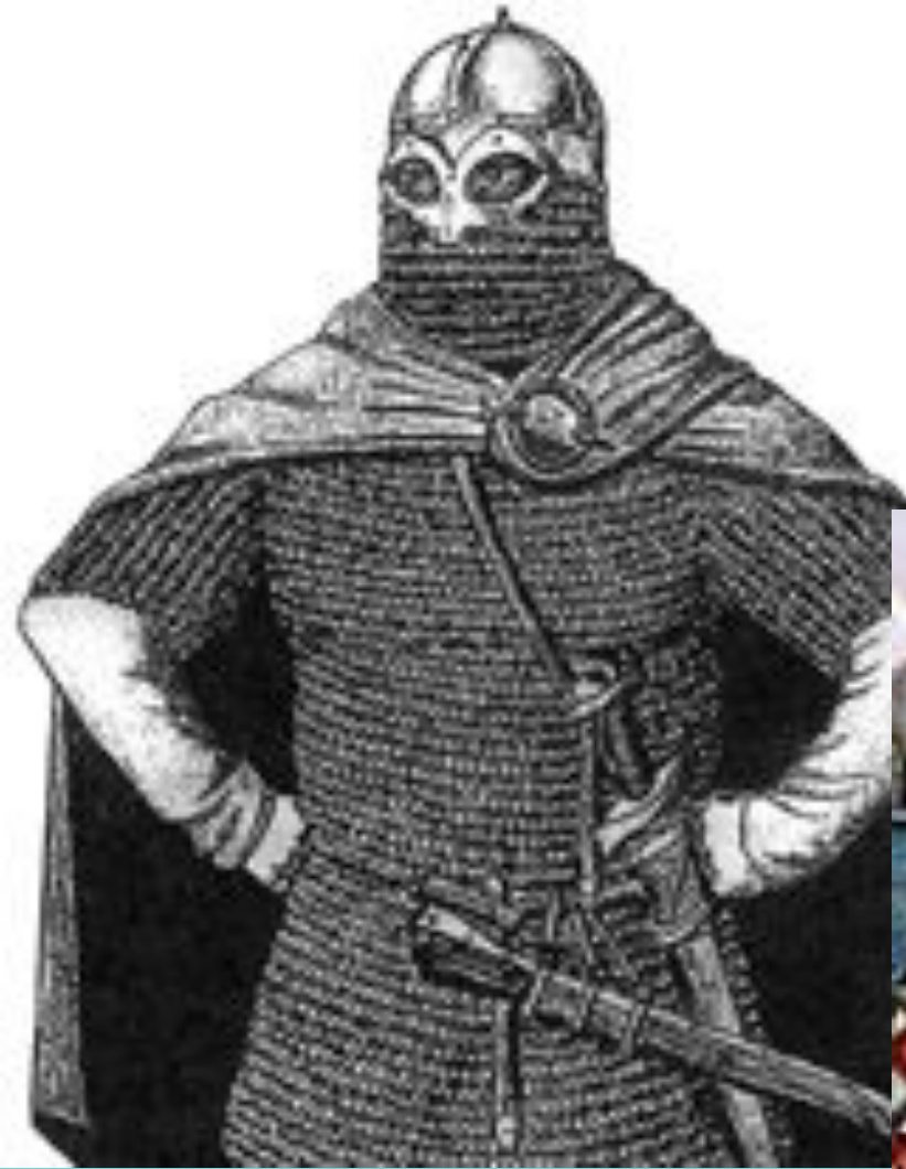
Викинг в кольчуге.