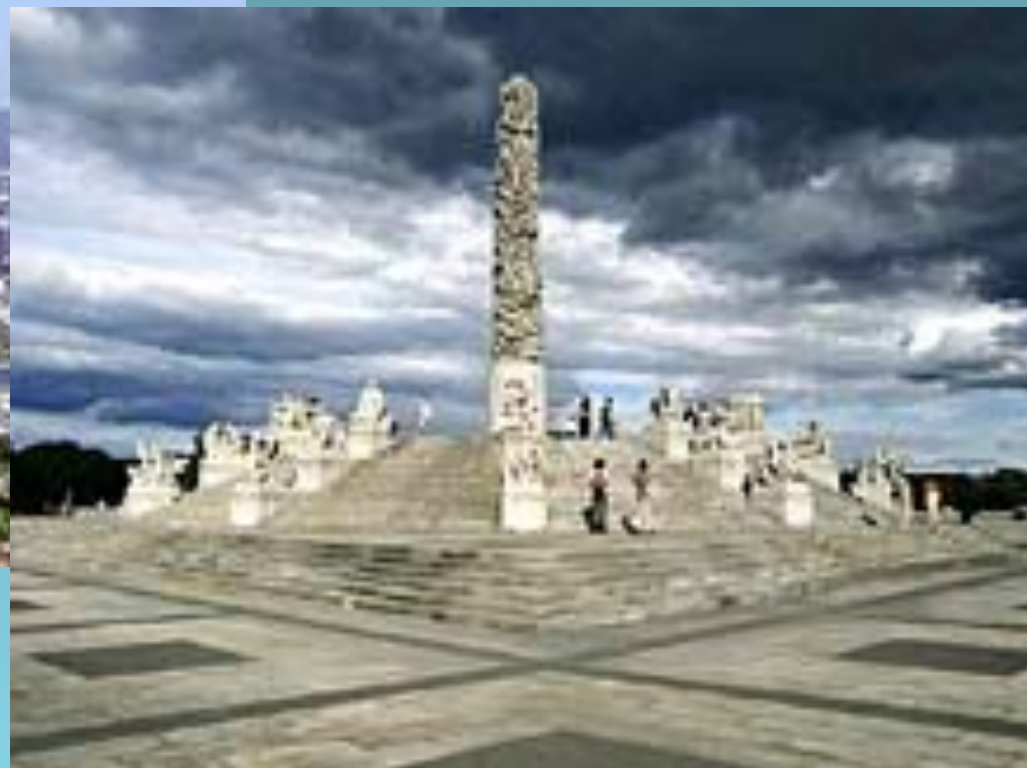
Фрогнепарк с гигантским скульптурным ансамблем Г. Вигеланна.