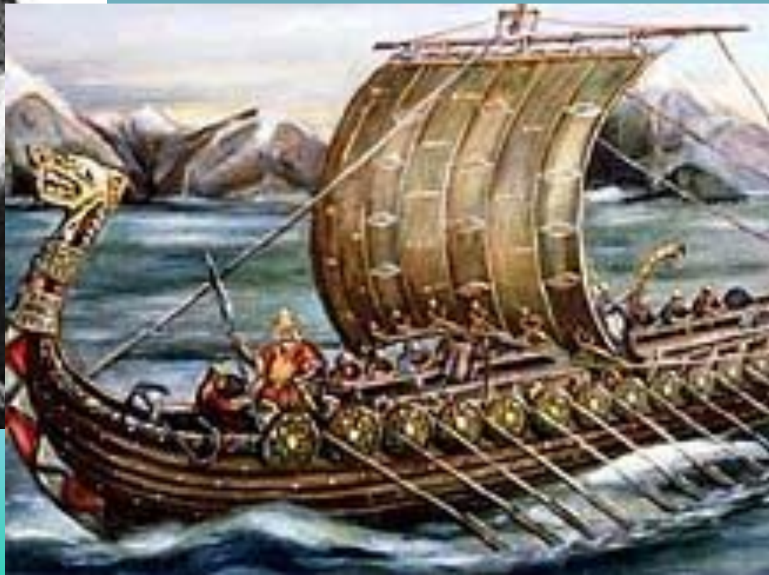
Парусная боевая ладья викингов.