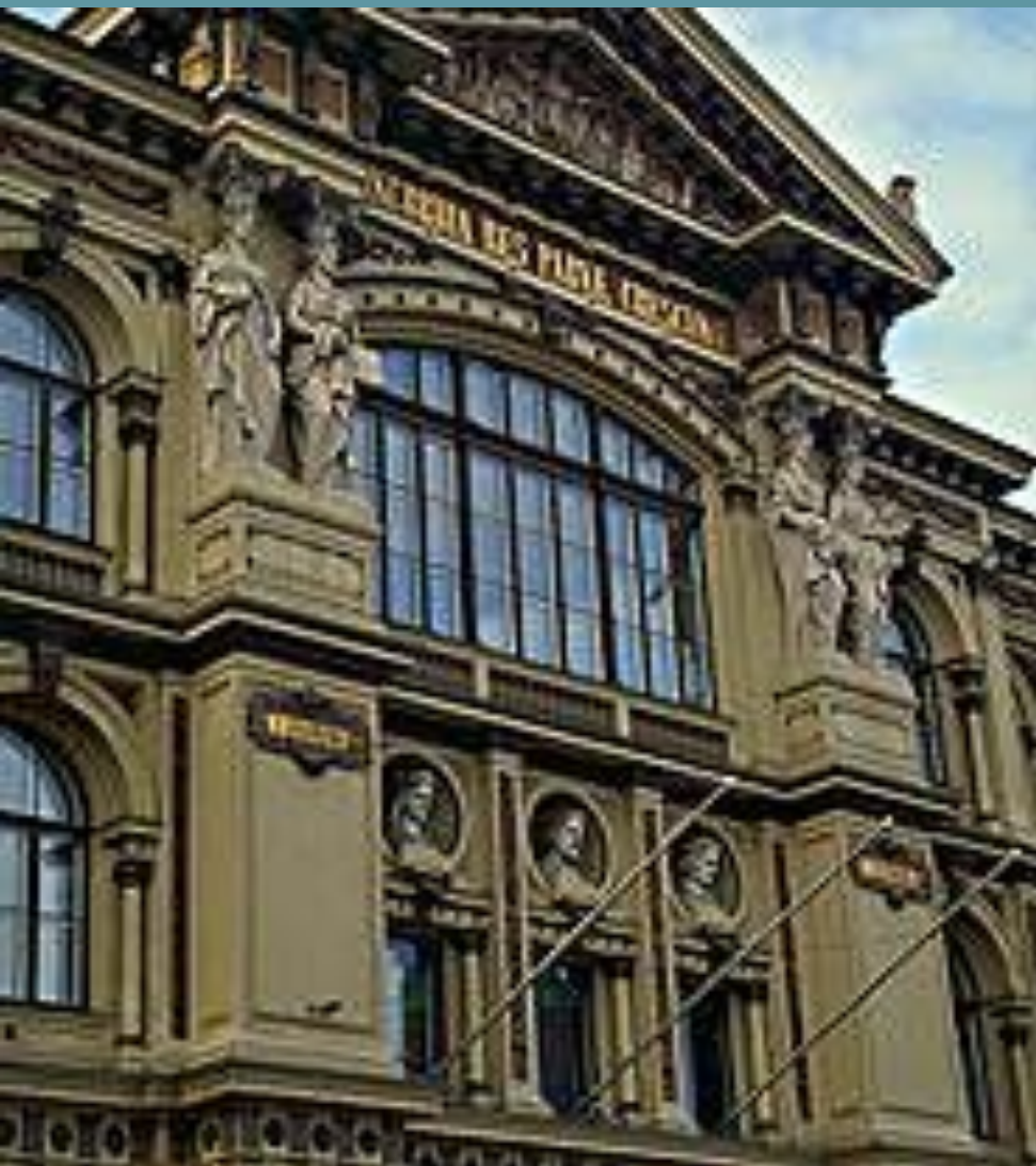
Хельсинки. Художественный музей.