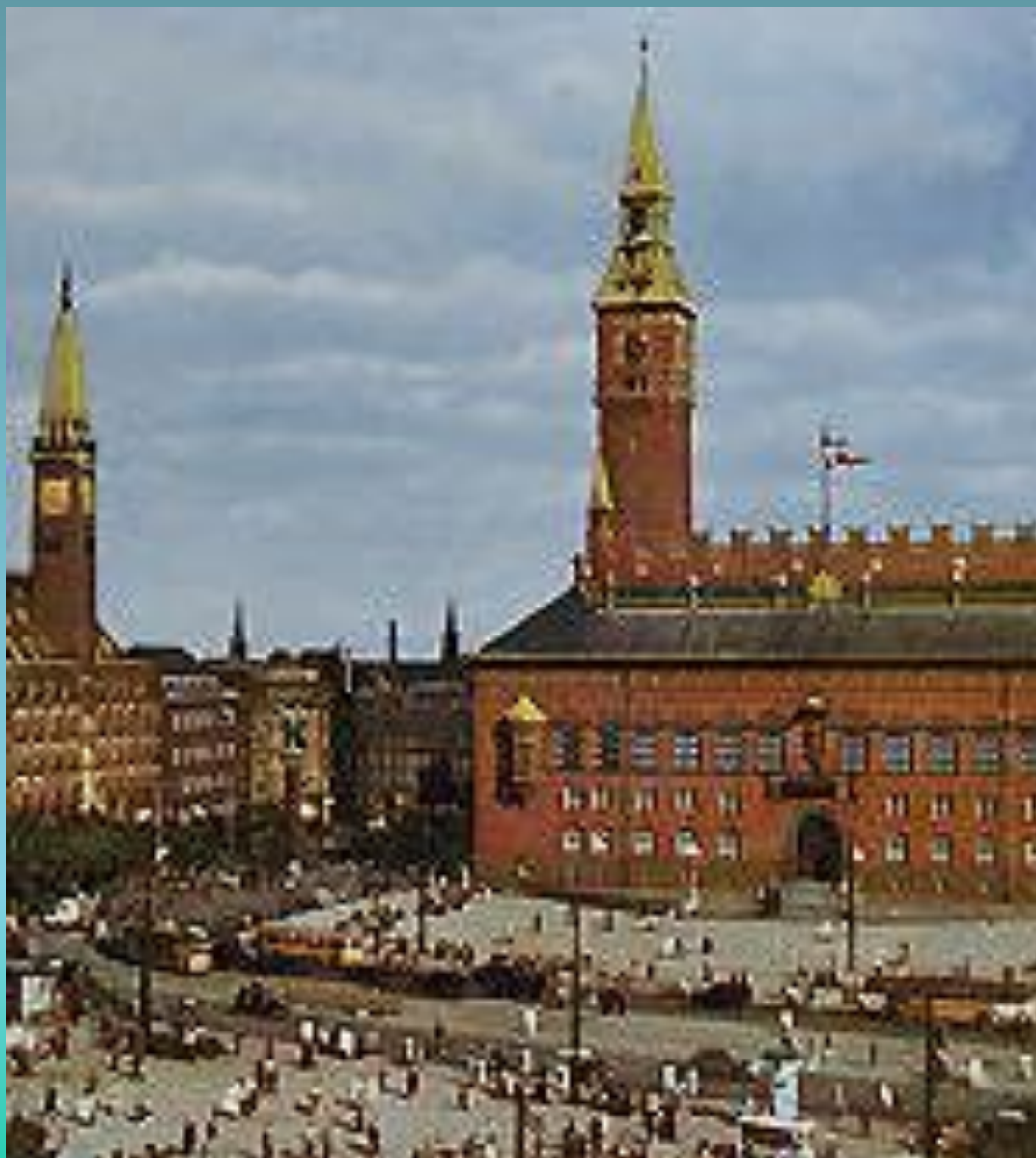
Центр Копенгагена. Ратуша.