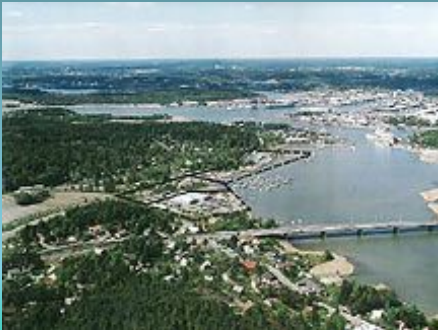
Турку. Панорама города.