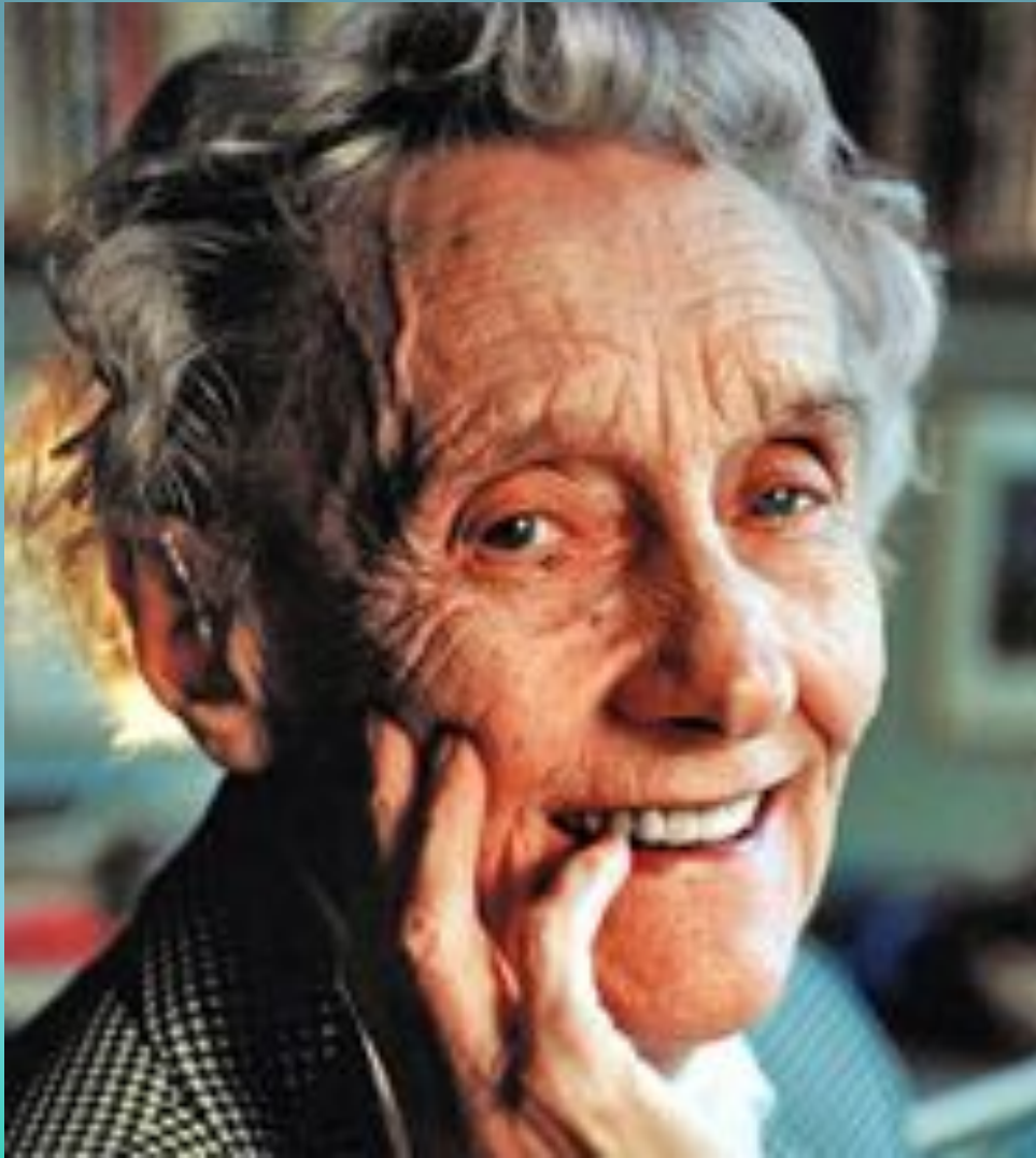
Астрид Линдгрен. Шведская Писательница.