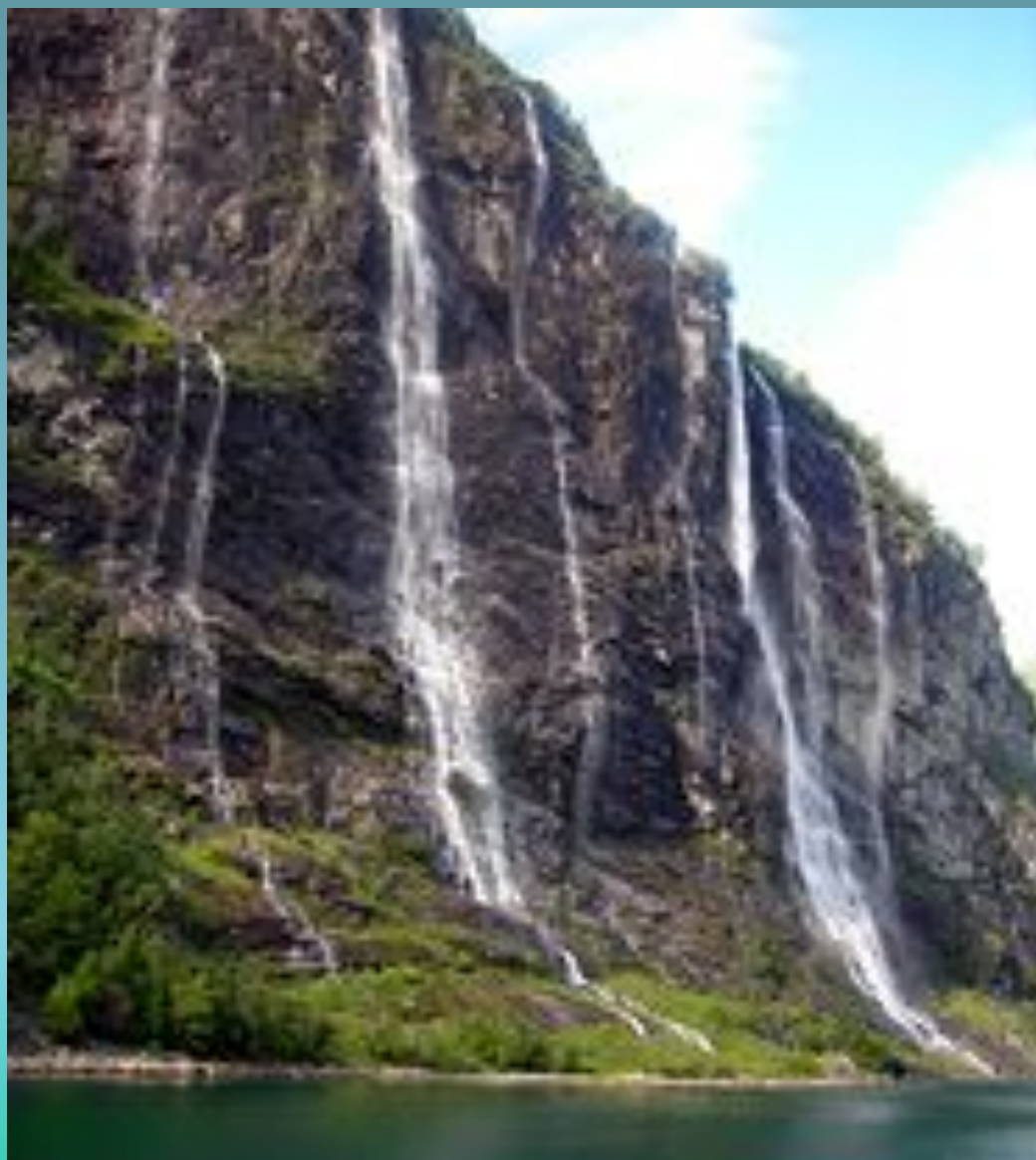
Гейрангерфьорд. Водопад «Семь сестер».