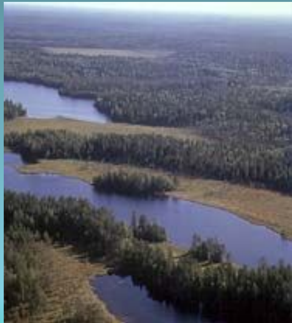
Характерный ландшафт на русско-финской границе