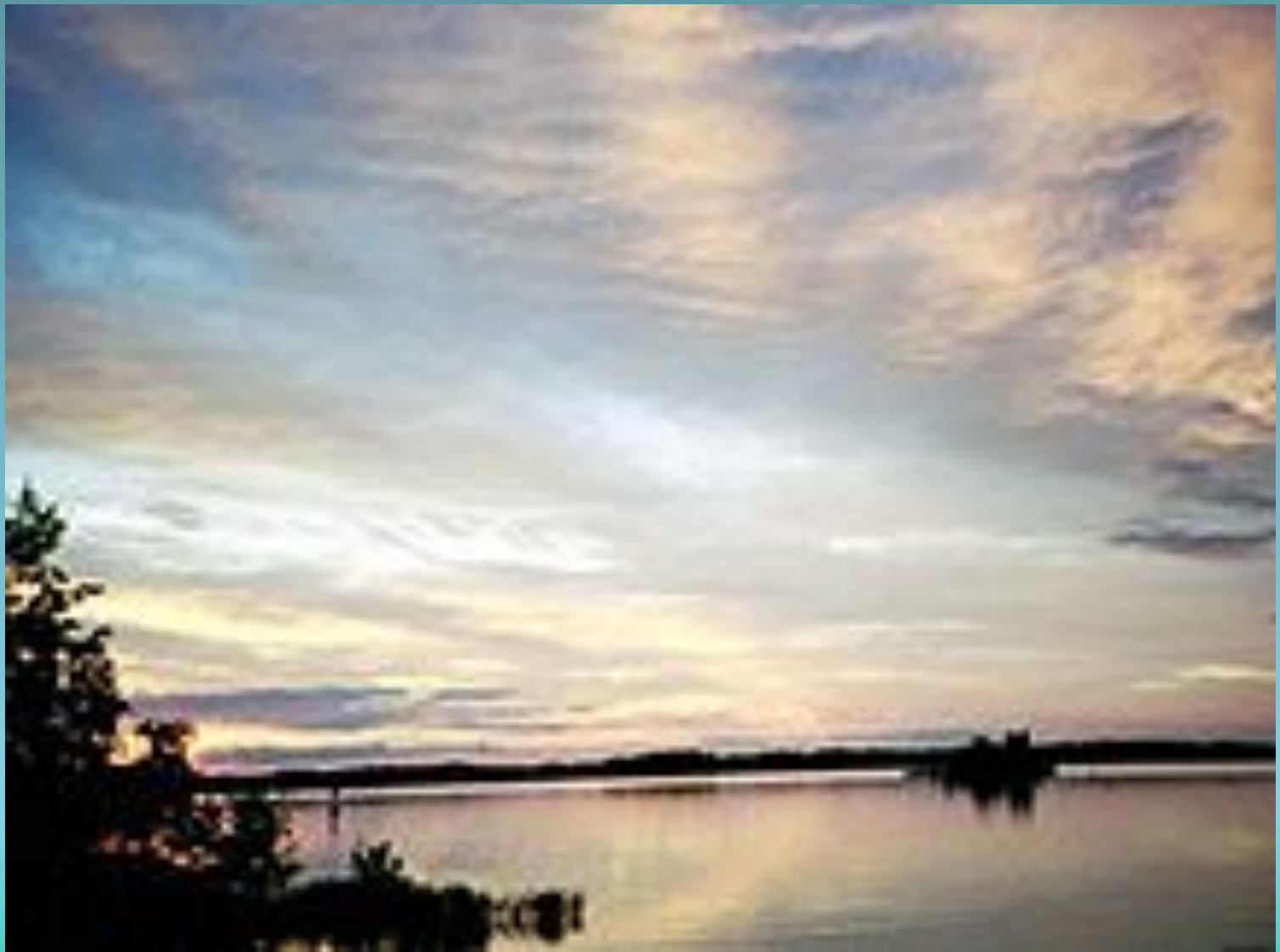
Сайма. Вид на предзакатное озеро.