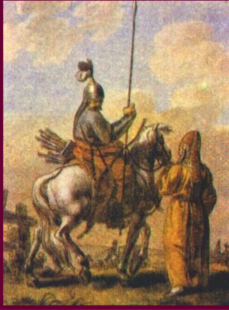
Е.Корнеев.Башкирцы. Рисунок к.18 в.

В 1705-11 гг. мощное восстание охватило Башкирию. Оно было вызвано произволом сборщиков налогов, которые ввели сразу 72 новые подати. Чиновники издевались над башкирами и оскорбляли их национальные и религиозные чувства. Во главе восстания встала местная знать и духовенство. Русские деревни были разграблены, а их жители проданы в рабство в Турцию на помощь которой рассчитывали восставшие.