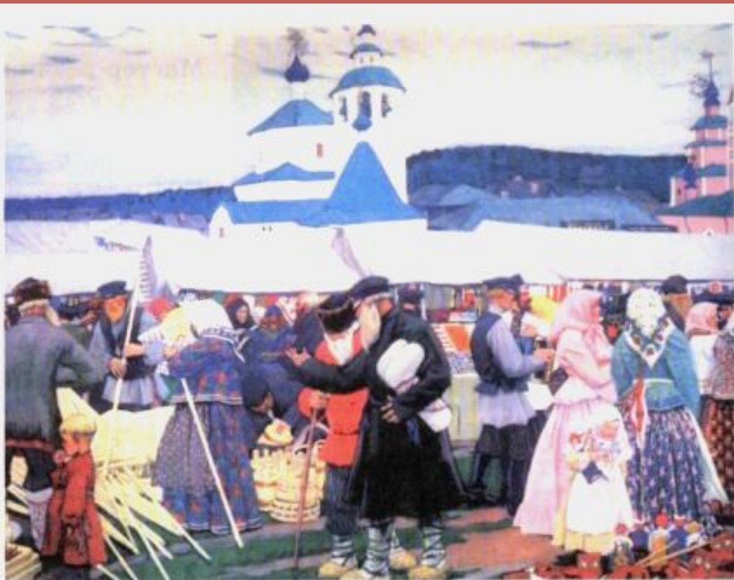
Б. КУСТОДИЕВ. Ярмарка.

Золотая хохлома - это нарядная, красочная деревянная посуда, которой издавна торговали на весёлых ярмарках в старинном селе ХОХЛОМА.