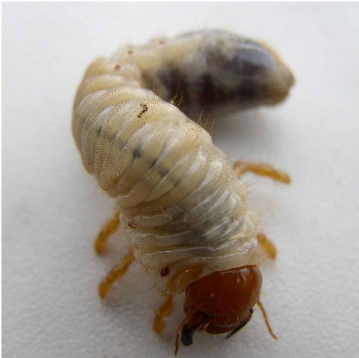
ЛИЧИНКА МАЙСКОГО ЖУКА