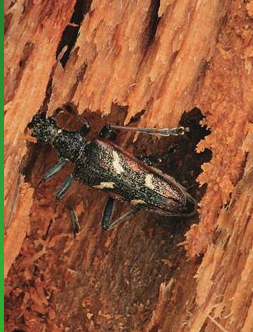
Жук – короед точильщик

Жуки – грызуны. Едят практически все- и растительный, и животный корм.