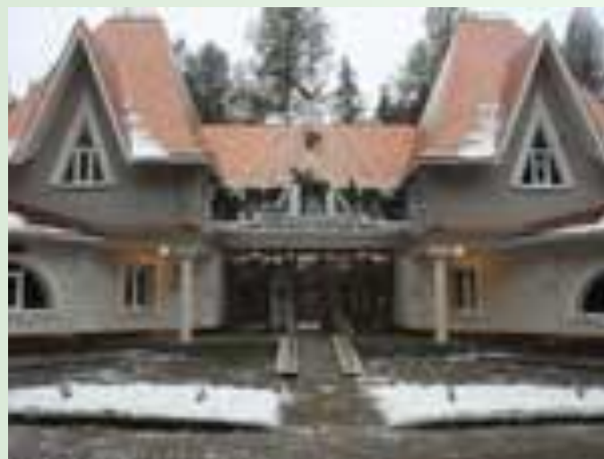
Филиал Московского зоопарка