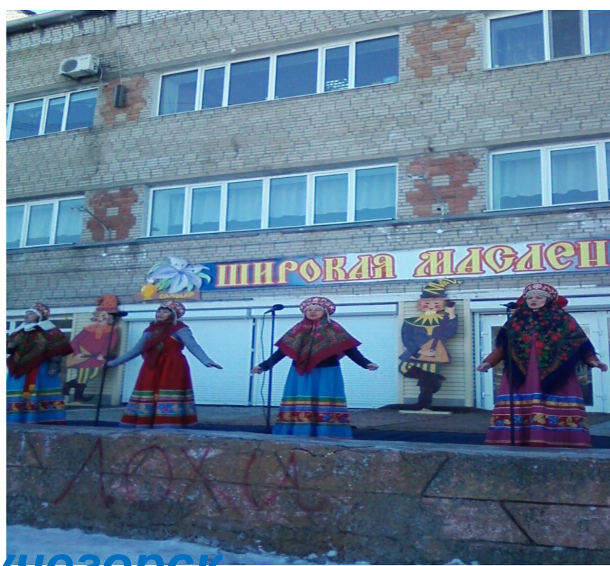
Традиции в посёлке Лучегорск