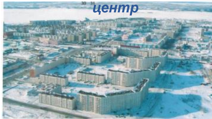
Надым - административный центр

В состав Надымского района входят три городских поселения - город Надым, поселки Пангоды и Заполярный и семь сельских поселений (в трех из которых проживают ненцы, коми-зыряне, селькупы, ханты – коренные народы Севера). Численность населения Надымского района составляет 67,8 тыс. жителей, 86% которых проживают в городских условиях