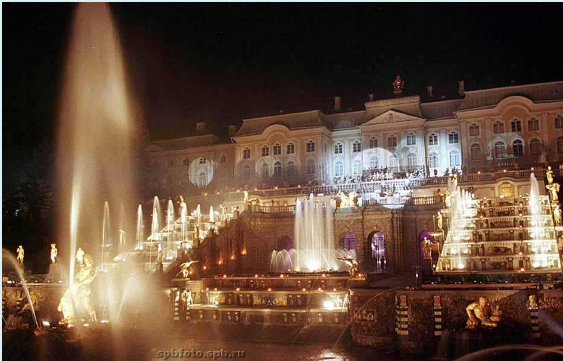
Фонтан «Большой каскад»