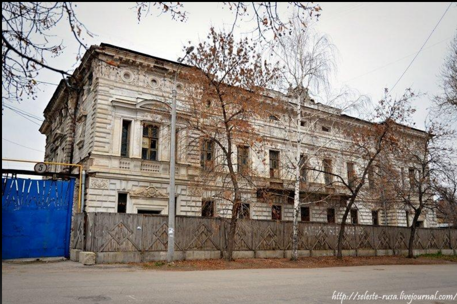
Ул. Алексея Толстого, дом №3. Особняк Субботиных-Шихобаловых, или Дом Губернатора