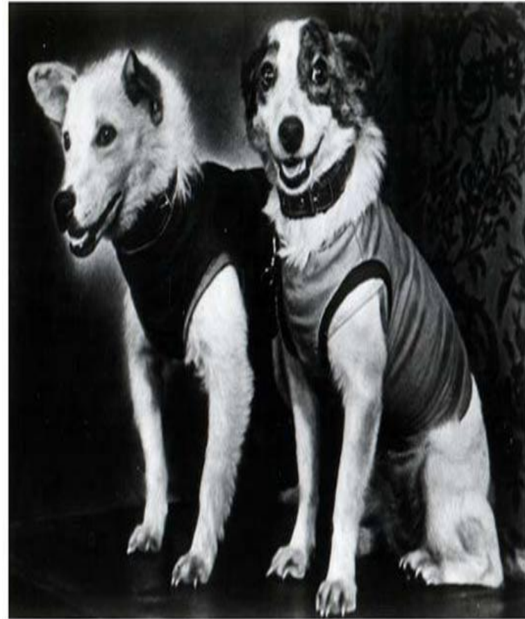
БЕЛКА И СТРЕЛКА