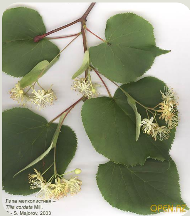
Липа мелколистная – Tilia cordata Mill. ? - S. Majorov, 2003 ? - S. Majorov, 2003 Липа мелколистная – Tilia cordata Mill.

Липа зацвела в июле, Соком сахарным полна. Ароматом словно тюлем Вся окуталась она.