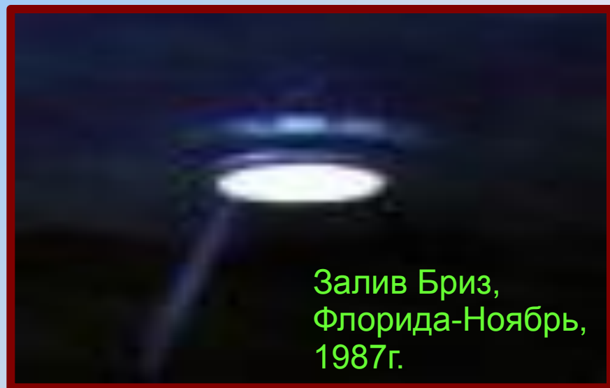
Залив Бриз, Флорида-Ноябрь, 1987г.