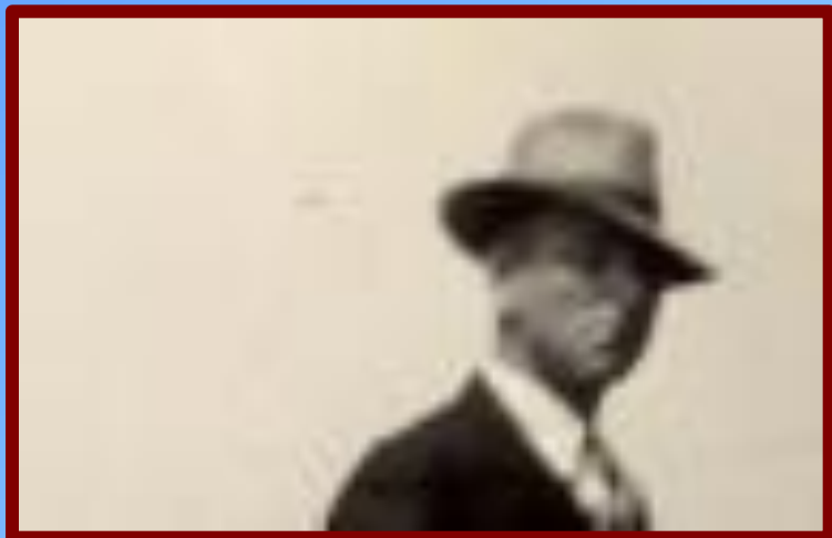
1 января 1939 г., США