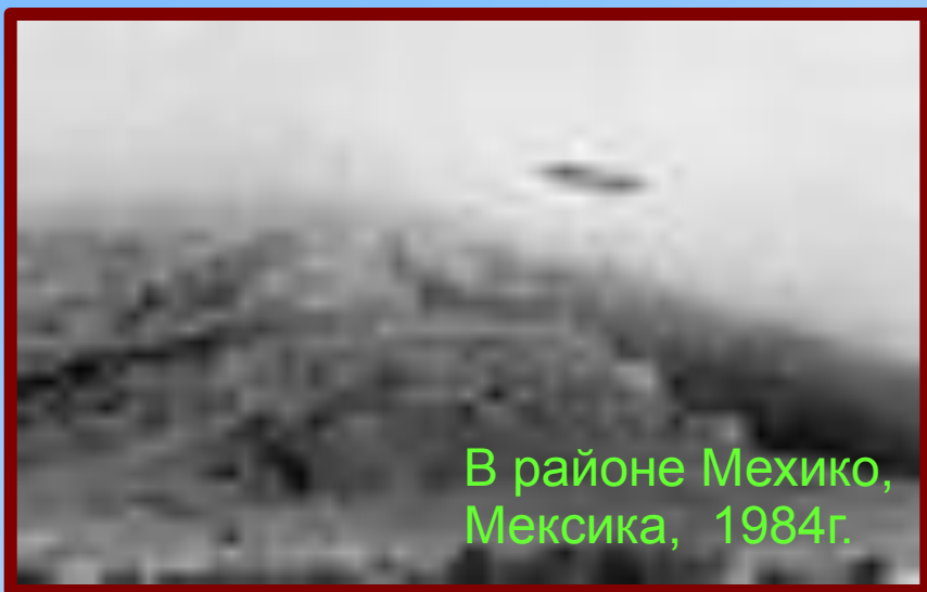
В районе Мехико, Мексика, 1984г.