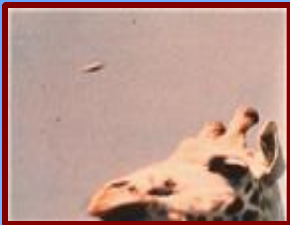
1986 г., Эфиопия