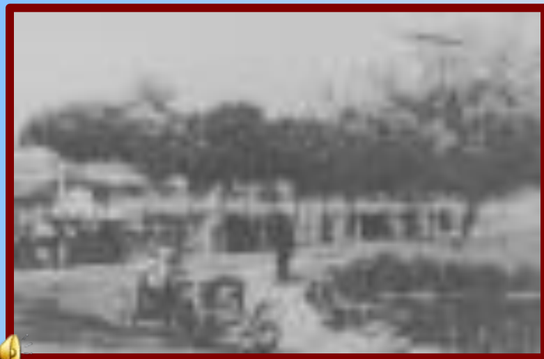
1910 г., Франция