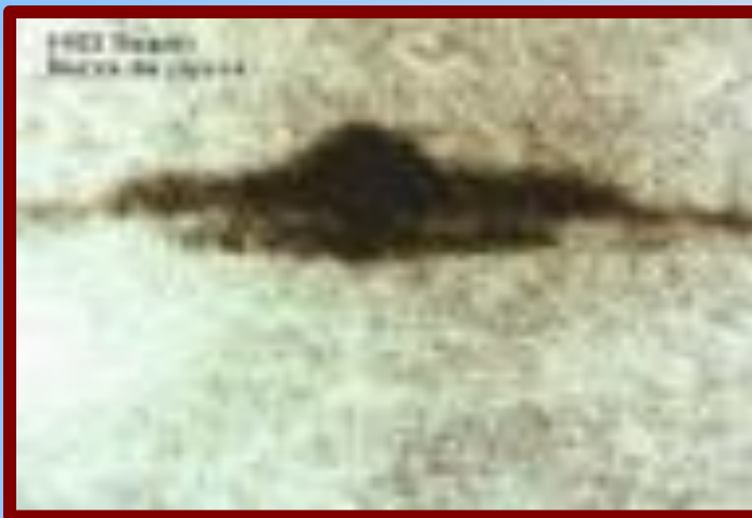
1995 г., США