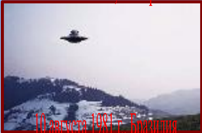
10 августа 1981 г., Бразилия