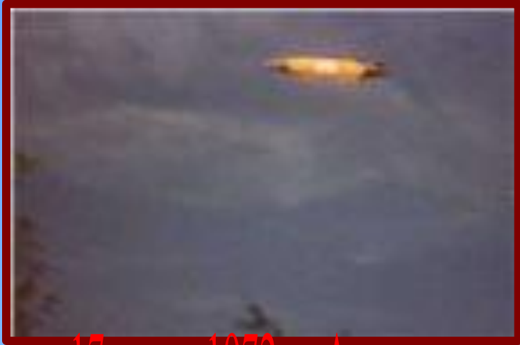
17 июня 1972 г., Австрия