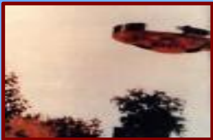
Париж, Франция 1953г