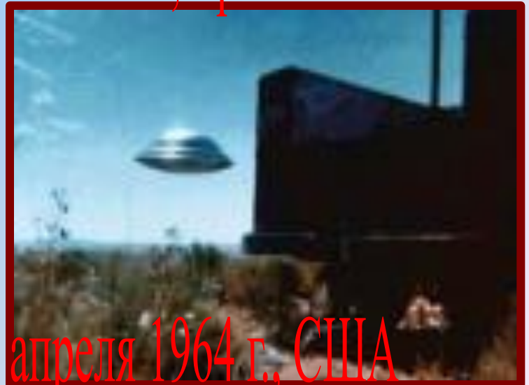
11 апреля 1964 г., США