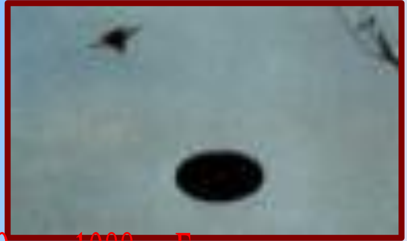
9 мая 1988 г., Бразилия