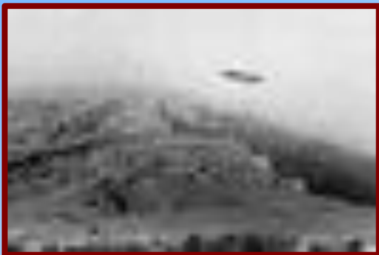
НЛО в Крыму