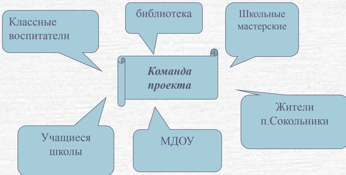
Схема взаимодействия участников проекта.