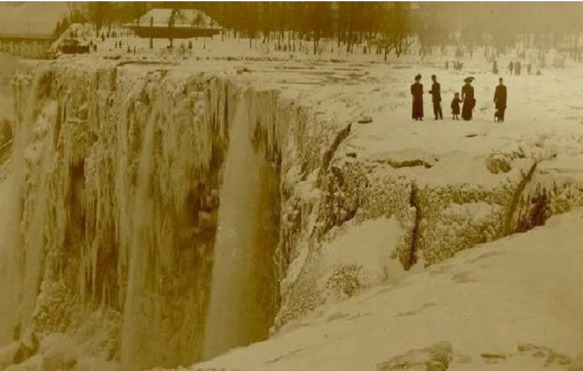
Ниагарский водопад замерз. Фото 1911 года