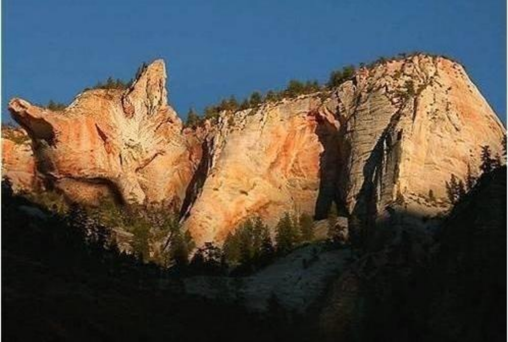
Гора в виде кота