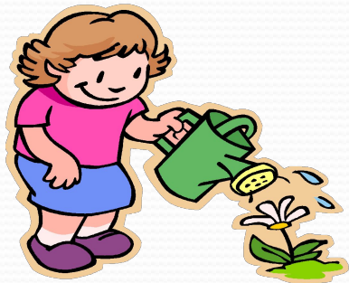
«Кому нужна вода»