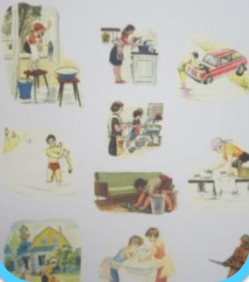
«Как человек использует воду»