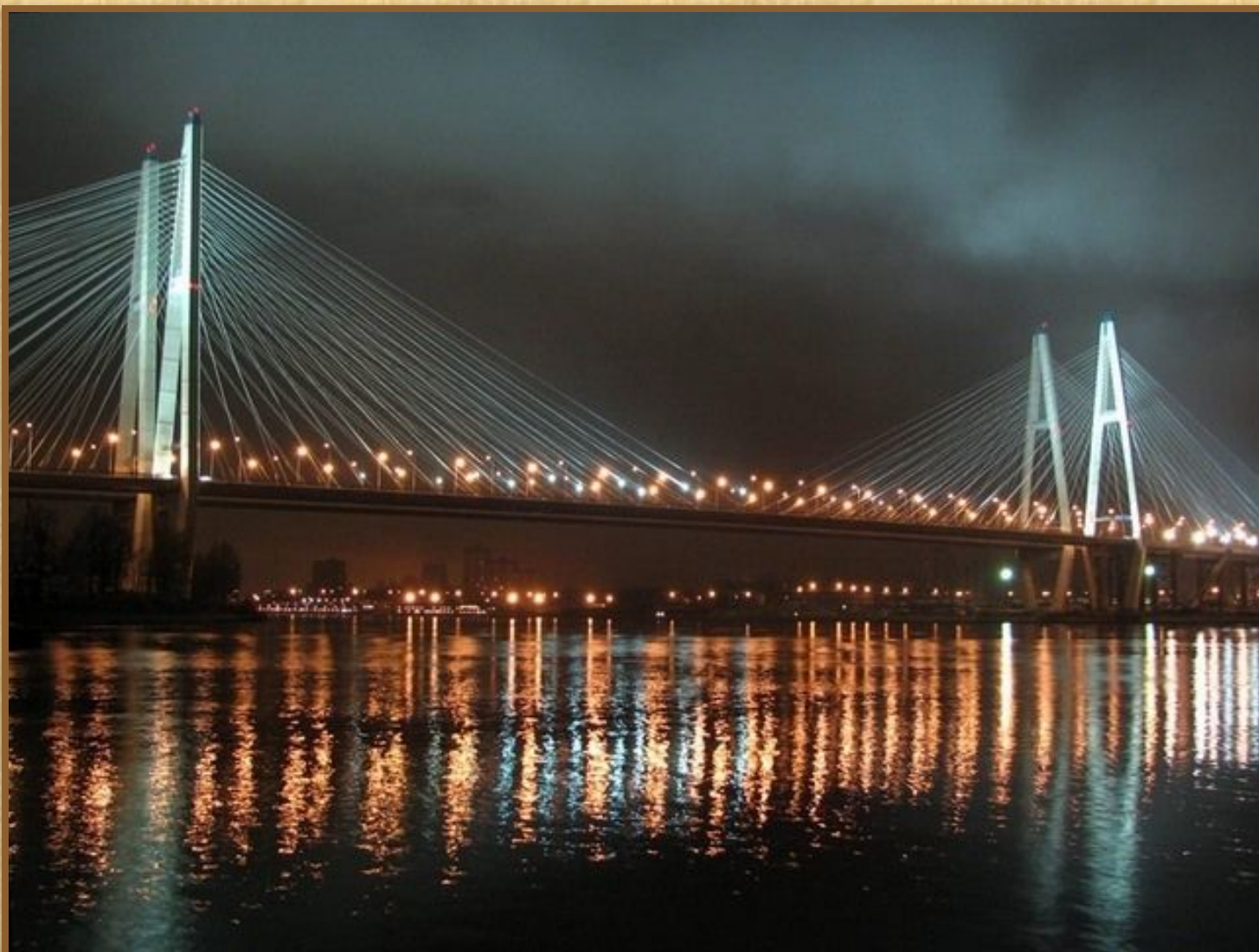
Большой Обуховский мост