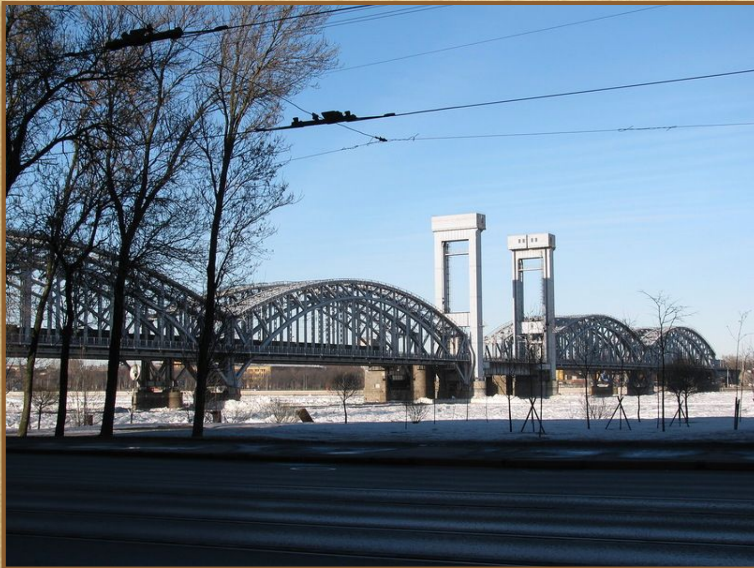
Финляндский железнодорожный мост