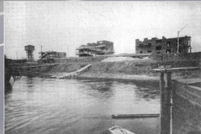
Начало строительства жилого городка