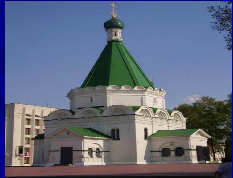
Михайло -Архангельский собор