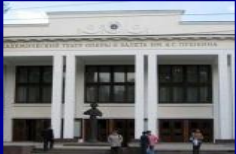
Театр оперы и балета имени Пушкина