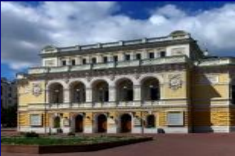
Театр драмы имени Горького