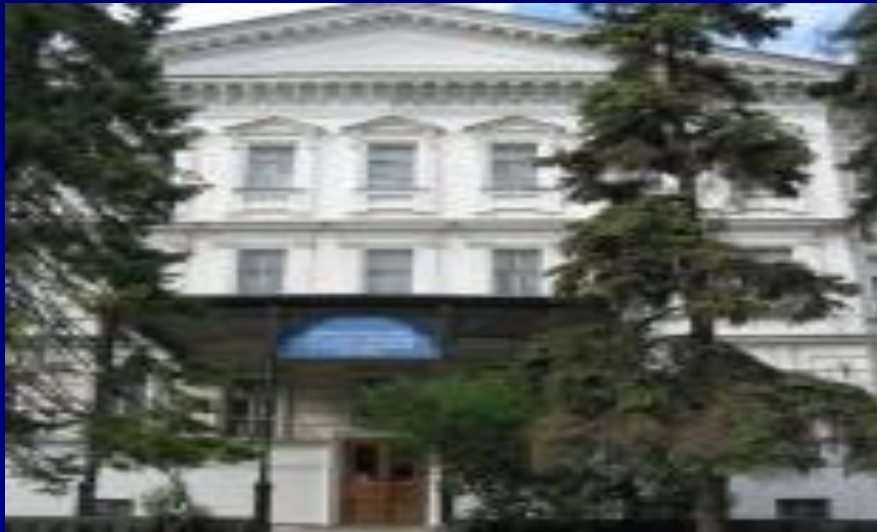
Государственный художественный музей