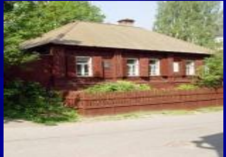
Музей детства А.М. Горького "Домик Каширина"