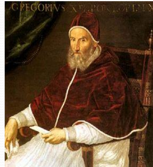
Папа Григорий 13-й