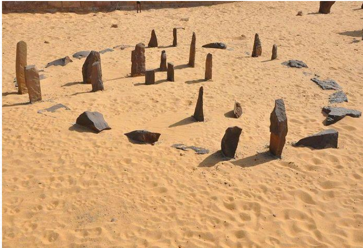
Первый каменный календарь