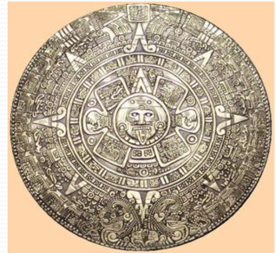
Древний календарь майя