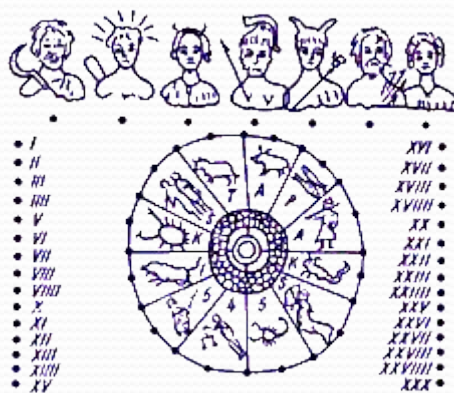
Древнеримский каменный календарь