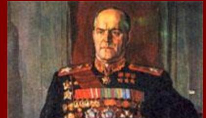
Маршал Георгий Константинович Жуков