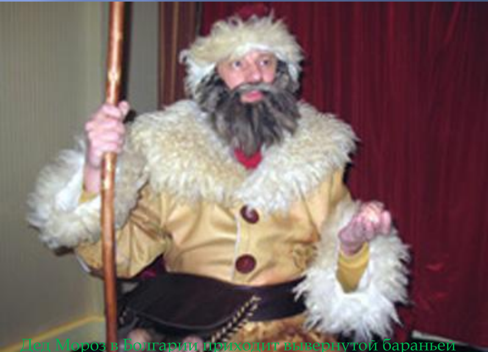
Дед Мороз в Болгарии приходит вывернутой бараньей шкуре