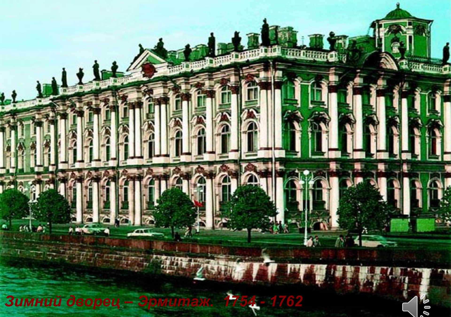
Зимний дворец – Эрмитаж. 1754 - 1762