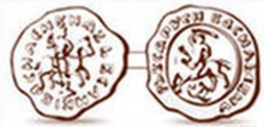
Монеты св. Владиміра Владиміровича великаго князя Владиміра св. кн. Владиміра