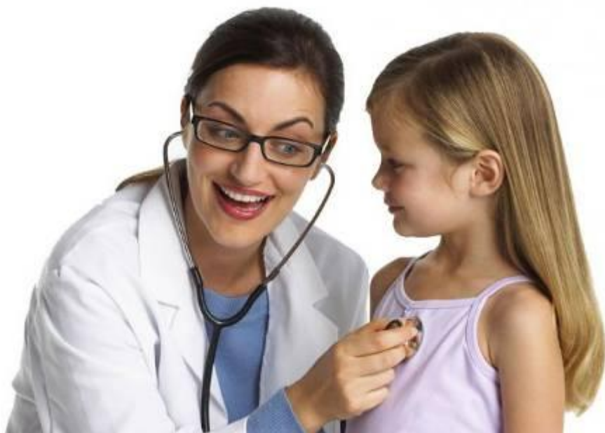
Детский врач (педиатр)