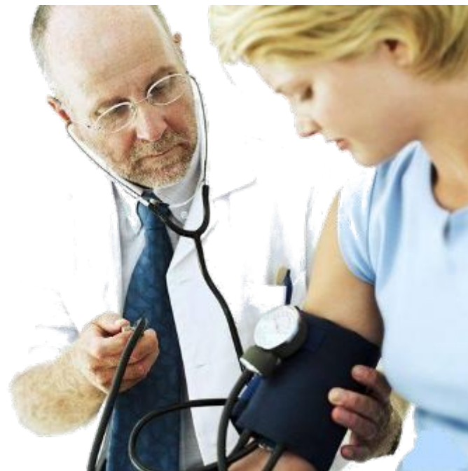
Врач для взрослых (терапевт)