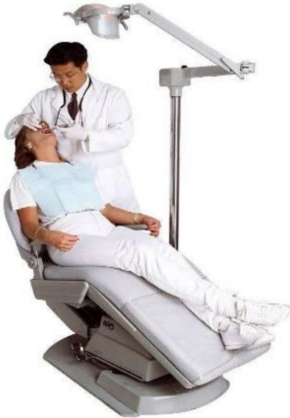
Зубной врач (стоматолог)