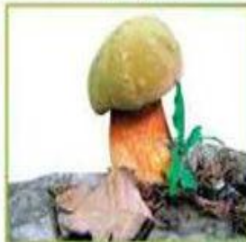
белый гриб (дубовый)