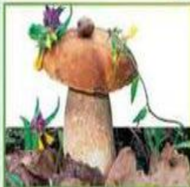
белый гриб (еловый)