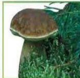
белый гриб (сосновый)