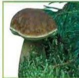
белый гриб (сосновый)