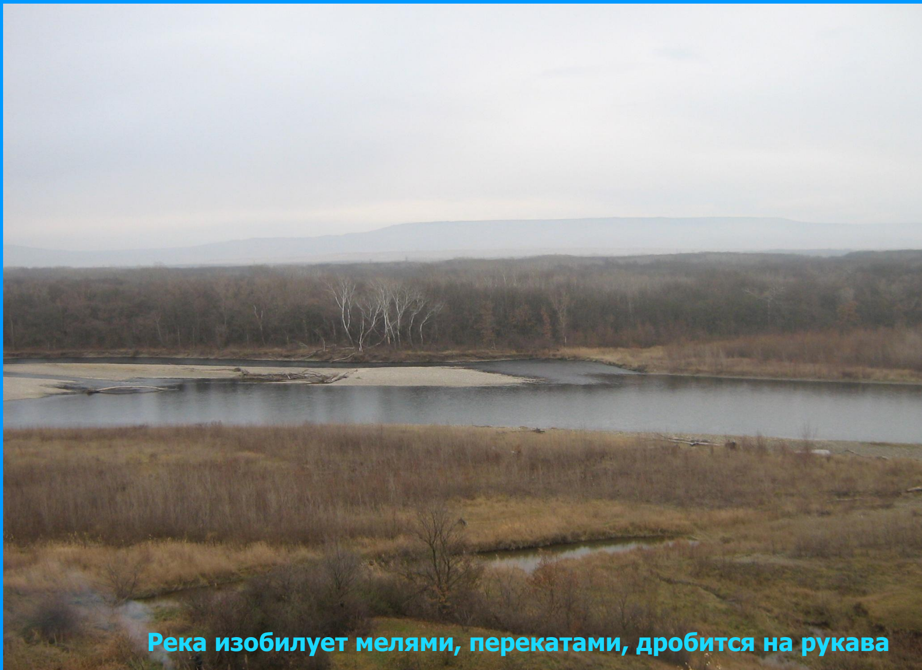
Река изобилует мелями, перекатами, дробится на рукава