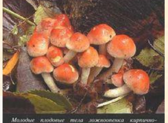
Молодые плодовые тела ложноопенка кирпично-