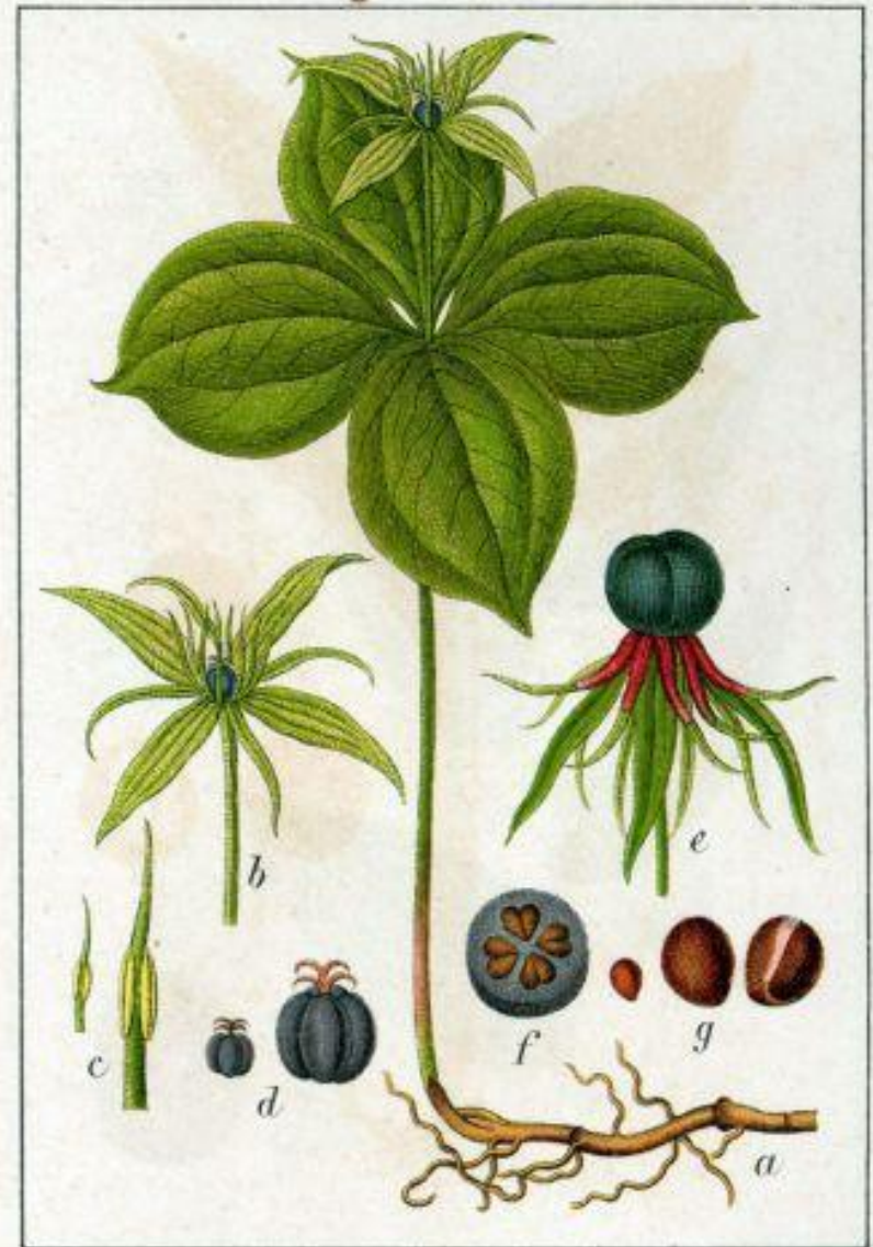
Einbeere, Paris quadrifolia.