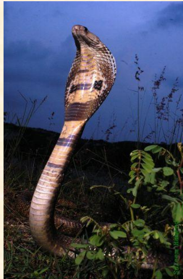
Индийская кобра или очковая кобра встает в специальную позу для нападения.