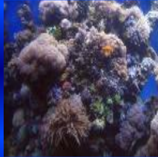
Кораллы и изделия из них