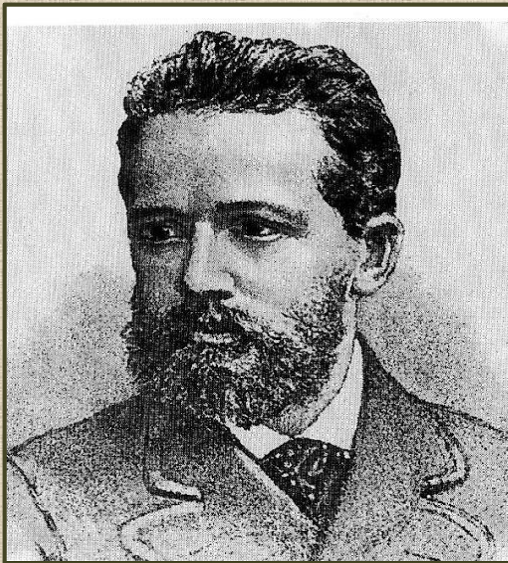
Пётр Ильич Чайковский 1840 – 1893 г.г.