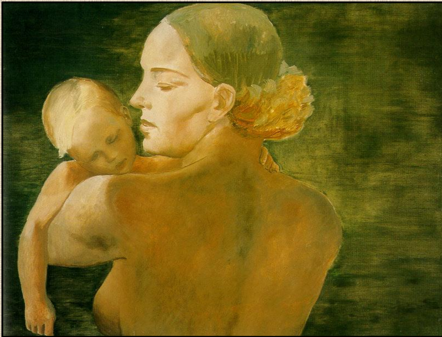
А. Дейнека « Мать »