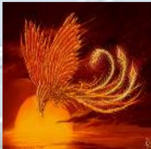
Жар - птица