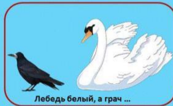
Лебедь белый, а грач ...