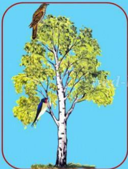
Кукушка сидит высоко, а ласточка ...