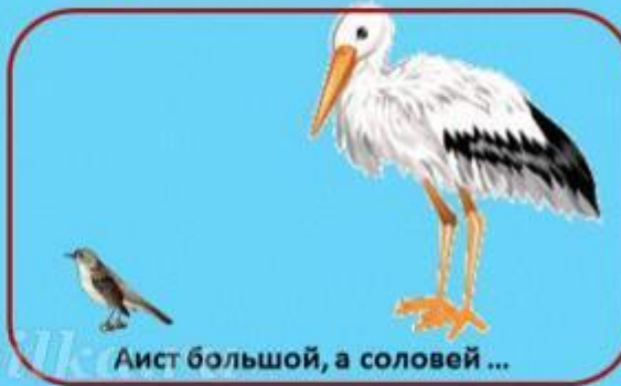
Аист большой, а соловей ...