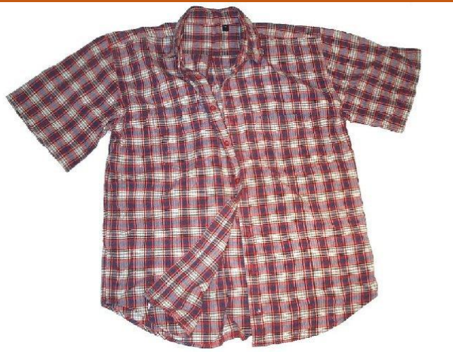
С КОРОТКИМ РУКАВОМ