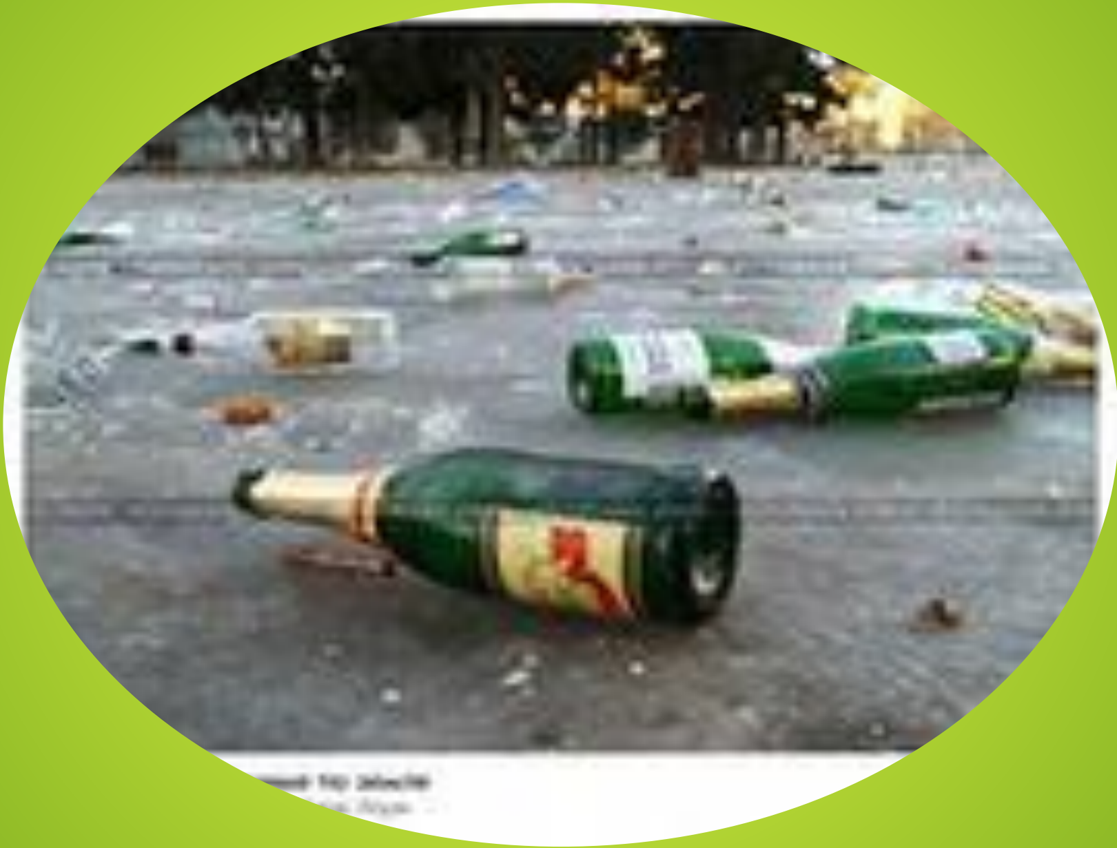
...and the ... ... from ...