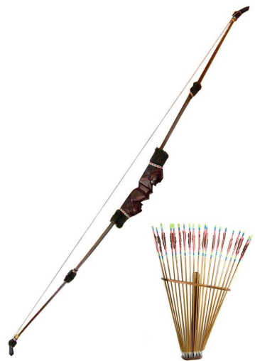
уха лук со стрелой