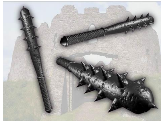
чукмар различные дубинки