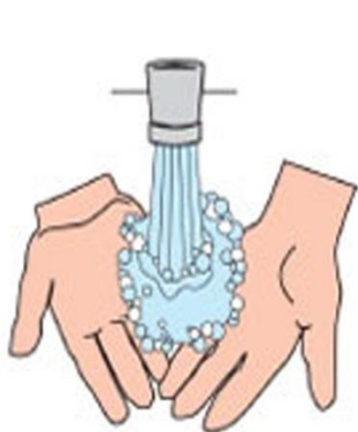
СХЕМА МЫТЬЯ РУК