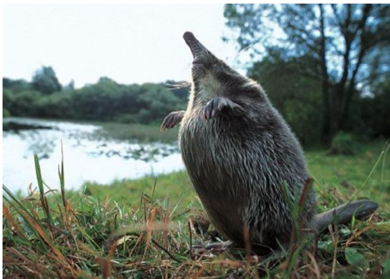
В озерах страны почти исчезла ВЫХУХОЛЬ