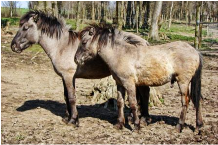
В степях - дикая лошадь тарпан