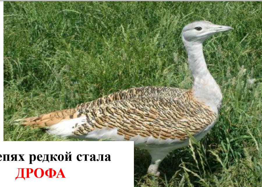
В степях редкой стала ДРОФА