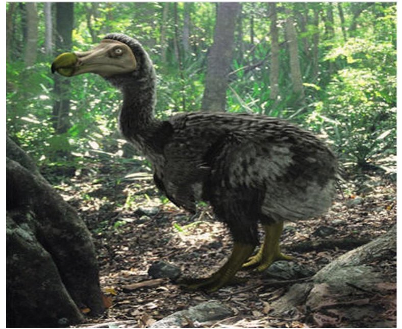
На островах в Индийском океане были уничтожены крупные нелетающие птицы – ДРОНТЫ .