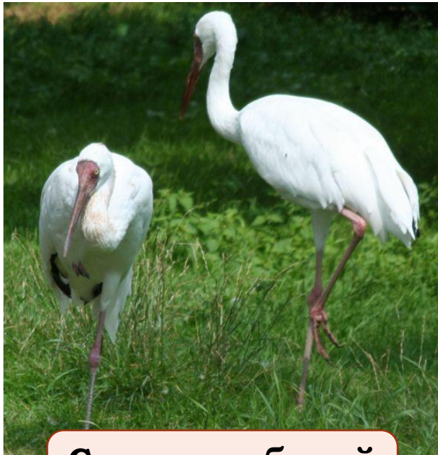
Стерх, или белый журавль