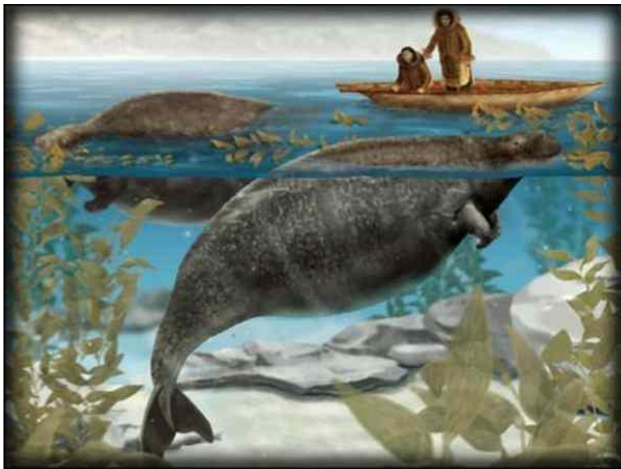
В Тихом океане была полностью истреблена морская корова - крупное морское млекопитающее, питающее водорослями.