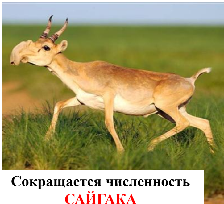
Сокращается численность САЙГАКА