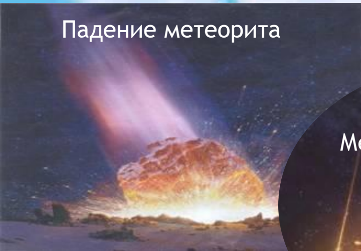
Сгорание метеорита в атмосфере Земли