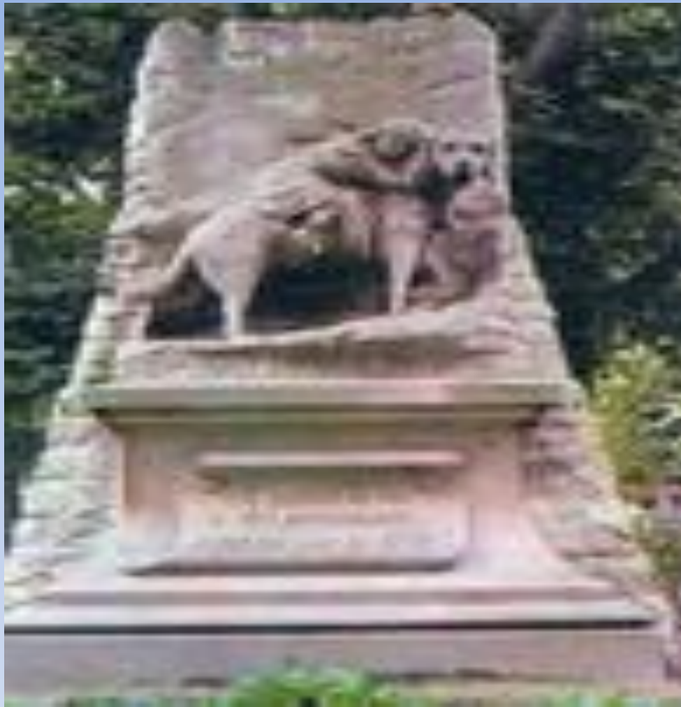
Памятник сенбернару Барри в Париже