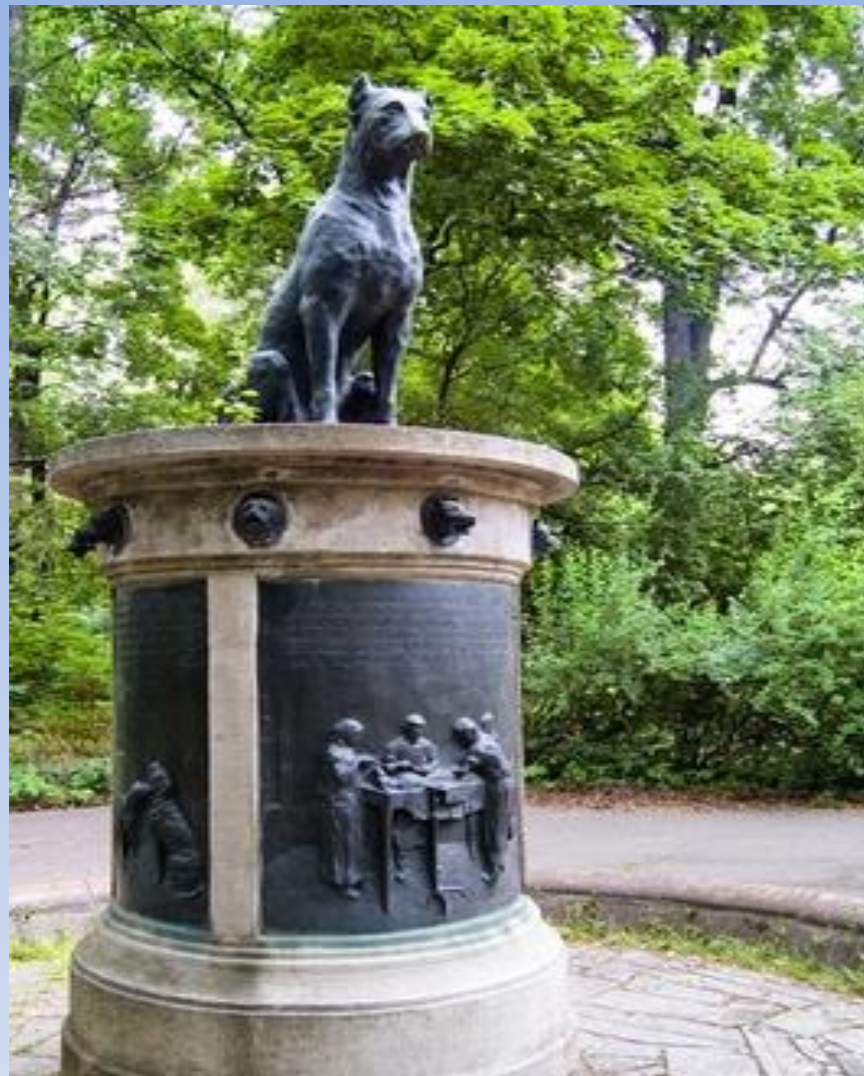
Памятник собаке И. Павлова Институт экспериментальной медицины г. Санкт-Петербург